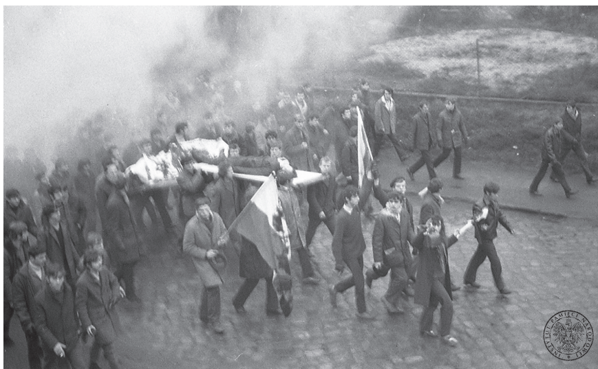
Grudzień 1970 r.

Przyjrzyj się fotografii i wykonaj polecenia.